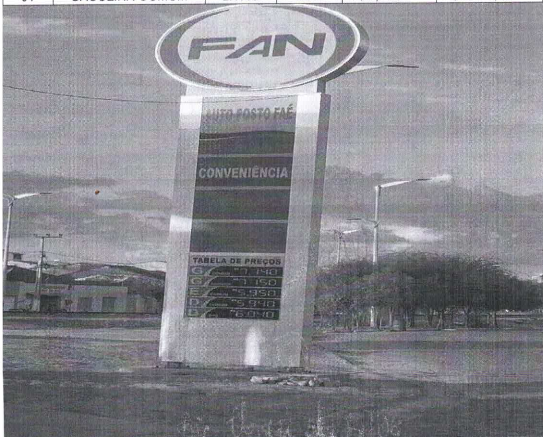
Imagem: Registro Fotográfico da Tabela de Preços do Auto Posto Fae Comercio de Combustivel LTDA, em Senador Pompeu Realizado no dia 30 de novembro de 2021.