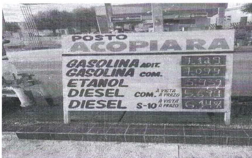
Imagem: Registro Fotográfico da Tabela de Preços do Posto Acopiara em Senador Pompeu Realizado no dia 30 de novembro de 2021.

EMPRESA: ALGODOEIRA E AGROPECUÁRIA RUFINO